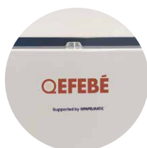
Dispensador LadyCare Personalizable*